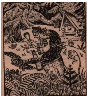
Рис. 15. Зеленый шум: хрестоматия для трудовой школы: Первый год / Сост. Е.Е. Соловьева и др. М., Пг., 1923. С. 59.

Далее количество волшебных произведений уменьшается, внимание ребенка переориентируется на загадки, пословицы, рассказы, песни, детские работы, стихотворения: «Электричество (рассказ мальчика)» 88 ; хоровая песня «Ну, товарищи, скорее!» 89 ; «Интернационал» 90 ; «Загадка про лапти» 91 ; «Пословица о труде» 92 . Уже позднее, начиная с 1925 г., сказки и вовсе пропадают со страниц пособий. Данные процессы помогают проследить стремление государства заменить мифологическое мировоззрение ребенка материалистическим.