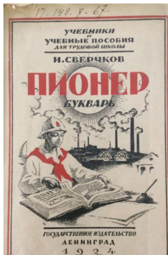
Рис. 8. Сверчков И. Пионер. Детский букварь: со 130 рис. Л., 1924. Обложка.

Пионерия появилась в 1922 г., уже в 1924 г. вышел букварь И. Сверчкова, где на обложке располагался прилежный пионер (см. рис. 8).