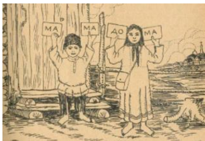
Рис. 7. Мироносицкий П.П. Словечко: книжка для обучения грамоте с методическими указаниями для учителя. Иркутск, 1922. С. 2.

Важным элементом азбук и букварей, оказывающим воспитательное воздействие на обучающихся, стала пионерия. Вначале в тексте фигурировали дети, еще не объединенные в какие-либо сообщества, что можно видеть в иллюстративном ряду (см. рис. 7).