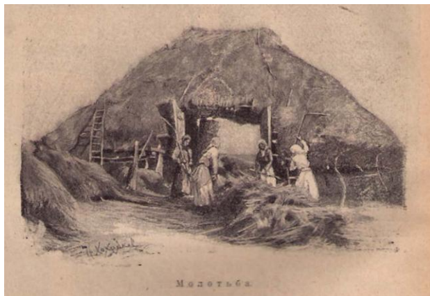
Рис. 12. Горбунов-Посадов И.И., Горбунова-Посадова Е.Е. Ясная звездочка: Вторая кн. для чтения дома и в шк. М., Пг., 1923. С. 176.