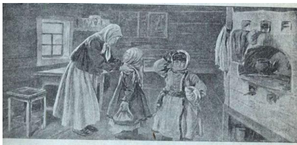
Рис. 4. Букварь «Живое слово» для классного и домашнего обучения чтению и письму / Под ред. А.А. Сольдина. М., Пг., 1918. С. 3.