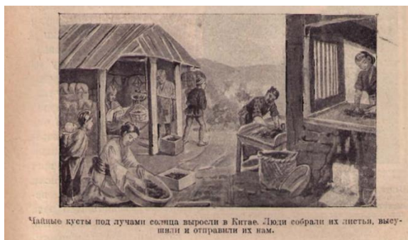
Рис. 9. Горбунов-Посадов И.И., Горбунова-Посадова Е.Е. Ясная звездочка: Вторая кн. для чтения дома и в шк. М., Пг., 1923. С. 147.

За работой можно видеть даже животных. При этом обратим внимание, что звери зачастую изображаются не по одиночке, а в процессе коллективного труда: либо вместе с сородичами, либо вместе с человеком (см. рис. 10; см. рис. 11).