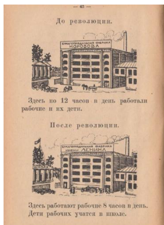
Рис. 3. Новая деревня. Книга для чтения в 1 группе сельской школы / сост. В.И. Волынская, Е.Е. Соловьева, А.М. Смирнова и др. М., Л., 1927. С. 42.

Таким образом, мы наблюдаем переосмысление исторических событий через призму социалистических идеалов. Особый акцент делался на идеях освобождения от дворянского угнетения. Все подчинялось принципу бинарной оппозиции, где царская Россия характеризовалась исключительно в негативных тонах, а советская власть являлась олицетворением идеального нового мира.