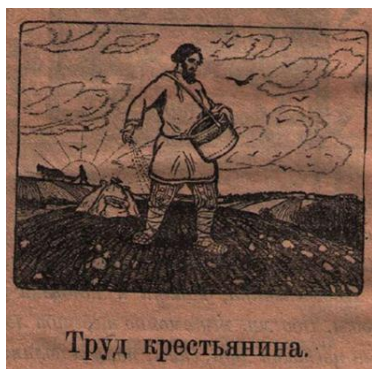
Рис. 13. Поляков В.Г. Солнышко. Букварь для обучения детей чтению и письму: с картинками для живых бесед и составления рассказов. М., Пг., 1923. С. 64.

Еще 2 года назад в букваре в заданиях к тексту фигурировал вопрос: «А в каких делах лошадь помогает крестьянину?» 76 . Сейчас же пишут: «Деревни и города – сила одна. Фабрики и заводы в городе <...> Крестьянину нужны бороны, плуги, жатки и другие машины <...> Деревня сильна хлебом – город машинами. Один