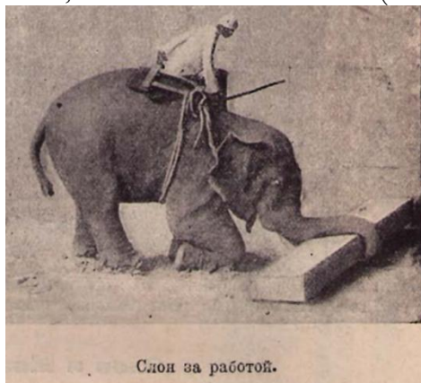
Рис. 10. Горбунов-Посадов И.И., Горбунова-Посадова Е.Е. Ясная звездочка: Вторая кн. для чтения дома и в шк. М., Пг., 1923. С. 153.

За работой можно видеть даже животных. При этом обратим внимание, что звери зачастую изображаются не по одиночке, а в процессе коллективного труда: либо вместе с сородичами, либо вместе с человеком (см. рис. 10; см. рис. 11).