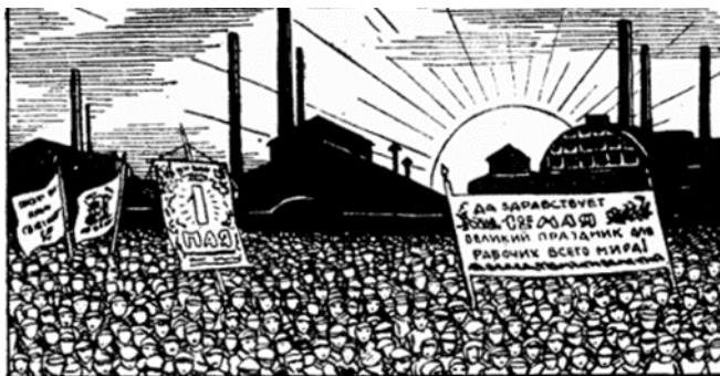
Рис. 16. Фридлянд Ф., Шалыт Е. За работой: Первая книга для чтения после букваря. М., 1924. С. 105.

Тексты про праздник «Первое мая» сопровождались соответствующим иллюстративным рядом. На изображениях можно было видеть большое количество людей, что формировало у ребенка чувство причастности к торжеству (см. рис. 16).