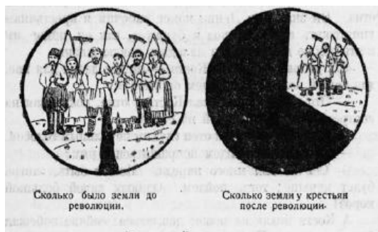
Рис. 1. Блонский П.П. Красная зорька. Книга для чтения в сельской школе. М., Л., 1925. Ч. 2. С. 87.

условий жизни простого человека после Октябрьской революции (см. рис. 1; см. рис. 2; см. рис. 3).