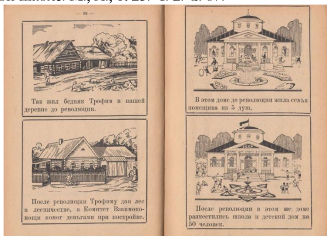
Рис. 2. Новая деревня. Книга для чтения в 1 группе сельской школы / сост. В.И. Волинская, Е.Е. Соловьева, А.М. Смирнова и др. М., Л., 1927. С. 38–39.